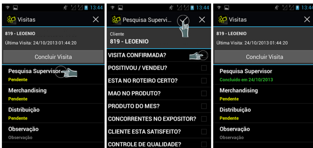
Mobile Supervisor – Modelo Questionário

Conforme as imagens abaixo, podemos ver um modelo de resposta do questionário que cabe à supervisão: