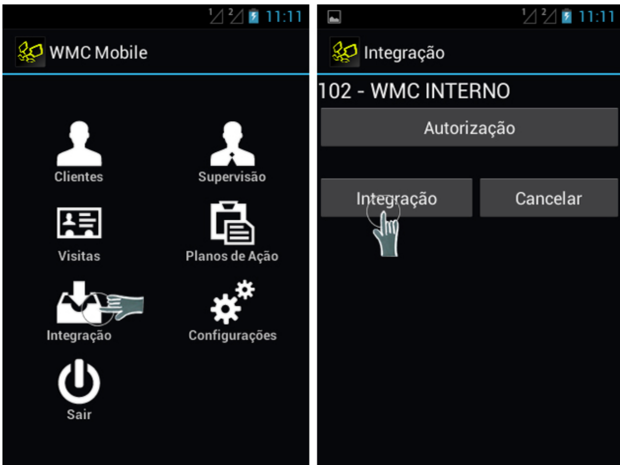
Mobile Supervisores – Integração Principal

A principal se localiza na tela inicial do sistema (veja imagem abaixo) e continua sendo a função que faz a associação completa das informações entre um sistema e outro: Mobile e Gestão. Esta integração atualiza os dados dos cadastros do supervisor e do sistema de gestão, permitindo gerar um relatório atualizado, por exemplo.